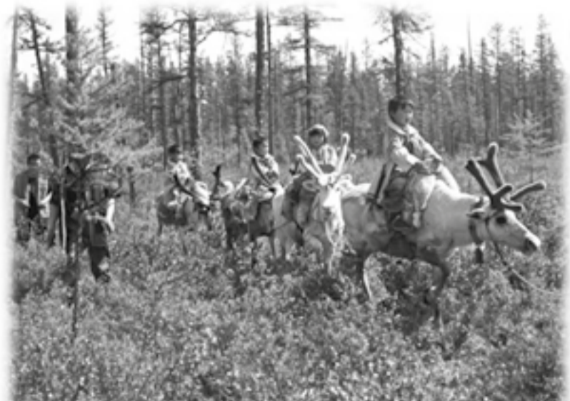
Омактала онгокилтула нулгидерэ