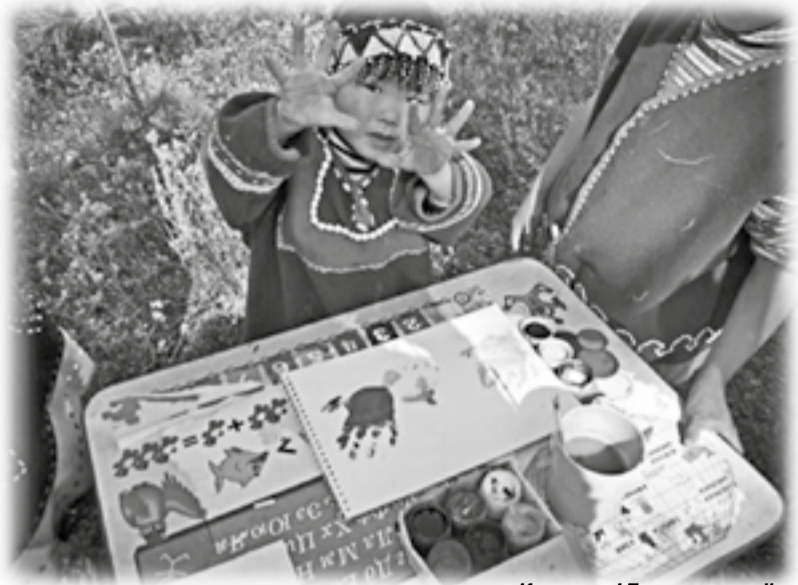
Ичэткэлл! Би нгалэви онём

Евдокия СИЛКИНА газетадук «Эвэды ин» № 35, 11 сирүдүндүк бегадук эвэдыт дукурэн