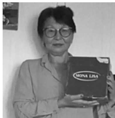
Самые активные участники онлайн-конкурса получили подарки