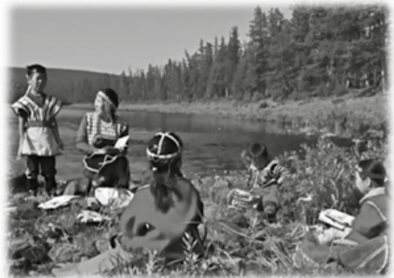
Дюганиду нэкукэр тулилэ алагувдянгикил